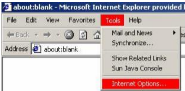
Internet Explorer 6